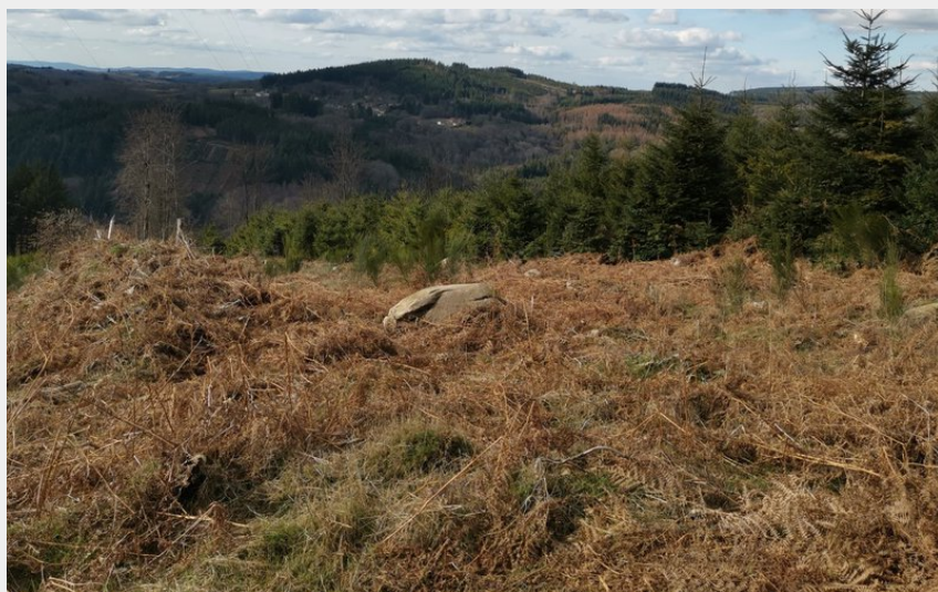
Paysage depuis le Puy la Chaise (bsavarypro)

Sud Creuse – Aubusson – lac de Vassivière – Saint-Pardoux-Mortierolles