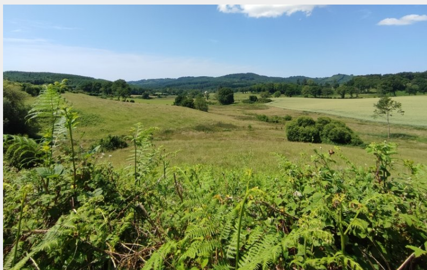
(A. Clavreul - PETR Monts et Barrages)

Vallée de la Vienne - lac de Vassivière - Saint-Moreil