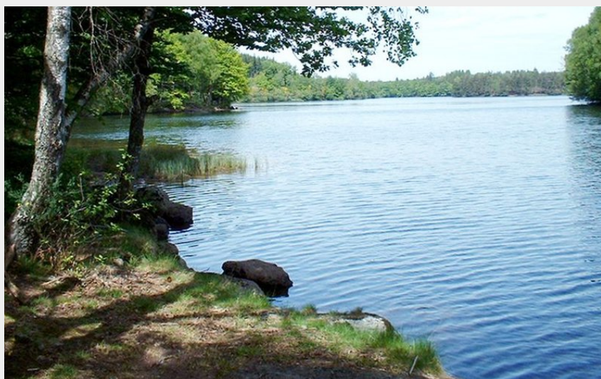
(Lac de Vassivière)