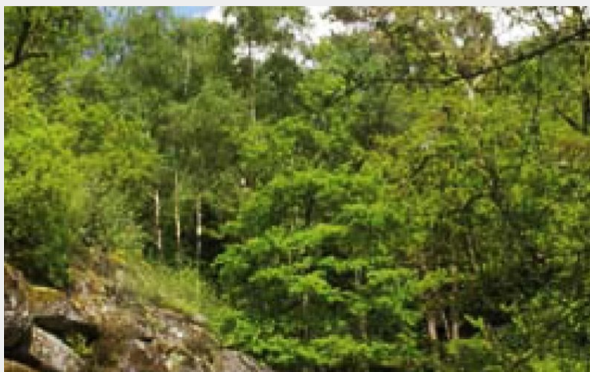
Les Pierres Fades (OT Aubusson-Felletin)

Sud Creuse - Aubusson - lac de Vassivière - Saint-Marc-à-Loubaud