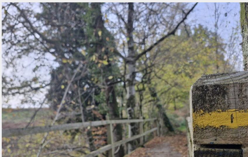
Circuit du pont de la roche