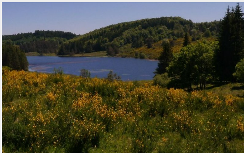
Étang des Oussines (CP AMM)