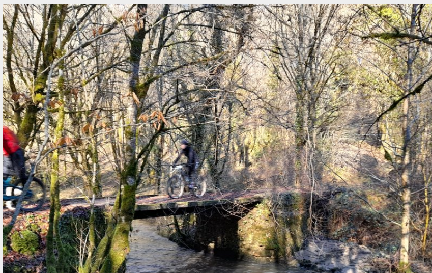
Passerelle du Moulin de la Forge